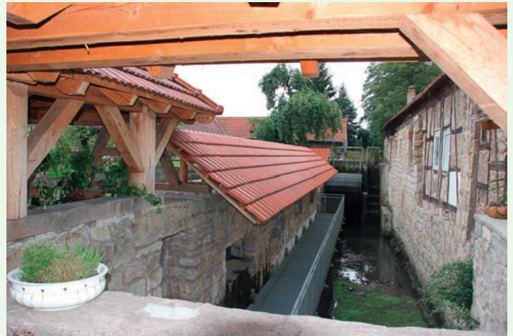
Die Hälteranlage in der Stedtener Mühle Schaugang am Flusssaquarium oberhalb des Mühlgrabens